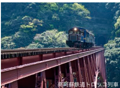
南阿蘇鉄道トロッキ列車